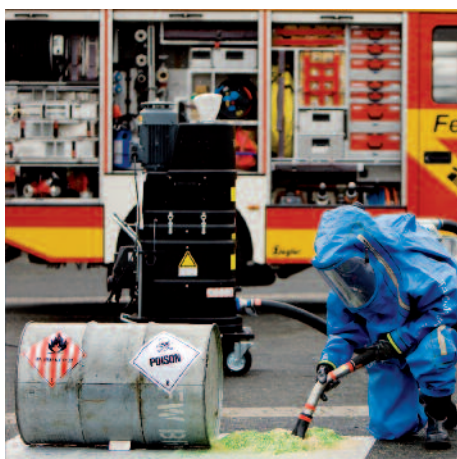
DS 1400 gázrobbanás ellen védett, tűzoltósági használatra