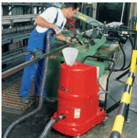
DS 1220 a fémgyártásban