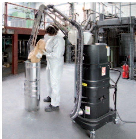
DS 1750 porrobbanás ellen védett, a műanyaggyártásban használatos elszívókarrel