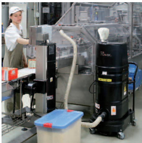
DS 1220 FS porrobbanás ellen védett, padlószívó berendezéssel, az agrárparban