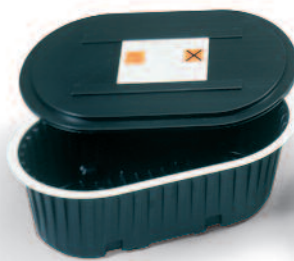
Hulladékkezelő tartály fedéllel