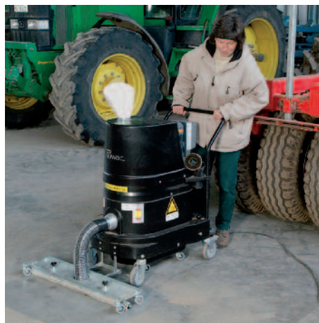
DS 1150 porrobbanás ellen védett, padlószívó berendezéssel, az agrárparban