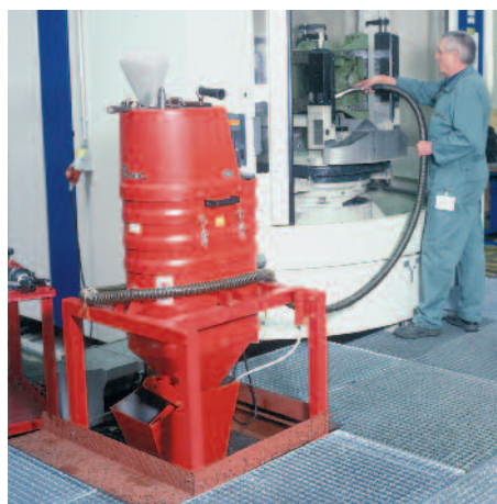
DS 1220 silópszívóként a fémgyártásban